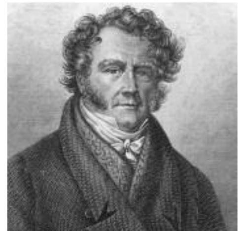
"ერთადერთი გრძნობა, რომელიც დამნაშეემ შეიძლება პოლიციელს გაუღვივოს – დაცინვა და გაოგნება" – ვენი ვილოკი

გამოძიების სფეროში კრიმინალისტიკა უდიდეს როლს ასრულებს. სხვადასხვა ანალიზებითა და ექსპერიმენტებით ექსპერტები დანაშაულის გახსნას და დამნაშავის დაკავებას ცდილობენ. თანამედროვე ტექნოლოგიებმა კრიმინალისტიკას წარმოუდგინებელი შესაძლებლობები მისცა. დრო, როდესაც დამნაშავის დაჭერისას გამოძიებლები მხოლოდ თითის ანაბეჭდების იმედზე იყვნენ, დიდი ხანია წარსულს ჩაბარდა.